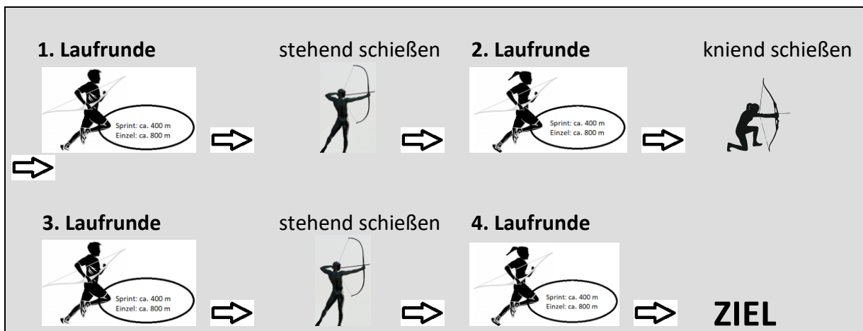
Abb. Ablauf Laufen – Schießen – Laufen

Insgesamt wird in allen Altersklassen viermal gelaufen und dreimal geschossen mit jeweils vier Pfeilen, so dass jede Athletin und jeder Athlet insgesamt 12 Pfeile benötigt. Alle Athletinnen und Athleten ab der Altersklasse U17 schießen nach der ersten Laufrunde stehend, nach der zweiten kniend und nach der dritten wieder stehend (siehe Abb.). Athletinnen und Athleten der Altersklassen unter U17 und ab dem 50. Lebensjahr wird es freigestellt, ob Sie in wechselnden Positionen oder nur stehend schießen.